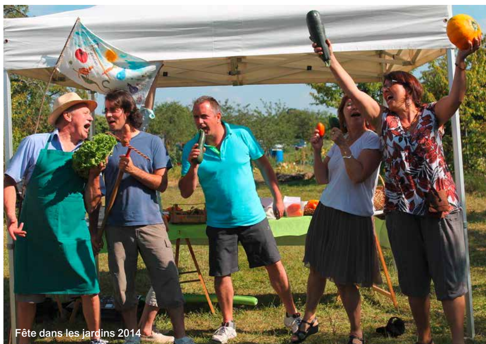
Fête dans les jardins 2014

Le site tout en restant ouvert, bocager, constitue aujourd'hui une véritable bulle de verdure, un dédale arboré entre zone urbanisée et vignes ordonnées.