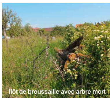
Îlot de broussaille avec arbre mort