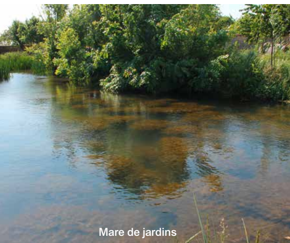
Mare de jardins

Continuer à agir dans la protection de la biodiversité à partir du travail de la ligue pour la protection des oiseaux ; dorénavant nous recherchons à préserver le continuum des chaînes alimentaires : autour des puits et de la mare et des flaques liées aux remontées de la nappe phréatique (du plancton à la couleuvre, en passant par l'alyte accoucheur et les tritons alpestres) autour des vergers et des prairies (de la graminée calcicole à la linotte mélodieuse) des friches abritant mammifères herbivores (chevreuils lapins) mais aussi nos ruches surveillées par un jardinier apiculteur. Seuls les papillons n'ont pas fait l'objet de l'étude particulière promise par l'entomologiste du Muséum d'histoire naturelle de Dijon.