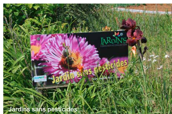
Jardins sans pesticides

Zone inondable et micro-parcelles ont protégé le site du mitage urbain, jusqu'à une époque récente où la pression urbaine s'est faite plus pressante et où l'autorité publique s'est dotée de moyens financiers, administratifs et matériels tels, que plus rien ne peut résister à l'étalement urbain.