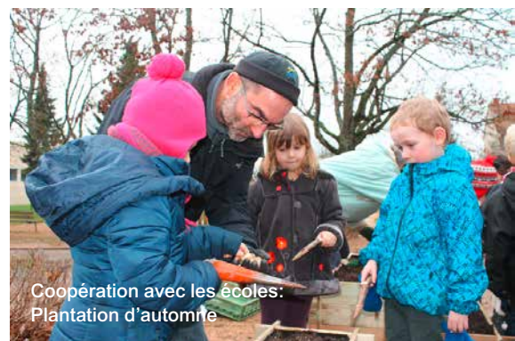
Coopération avec les écoles: Plantation d'automne

Qui y aurait cru il y a dix ans seulement ? Si ce n'est quelques irréductibles « rêveurs » déterminés.