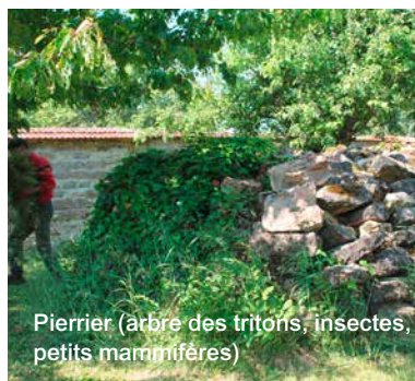
Pierrier (arbre des tritons, insectes, petits mammifères)

à une couverture du sol (paillage)... Les hérissons qui avaient déserté sont revenus en 2014. JVMC fournit en achat groupé le compost (4 tonnes en 2015) les engrais bio (guano) et a mis en place une aire de compostage collectif.