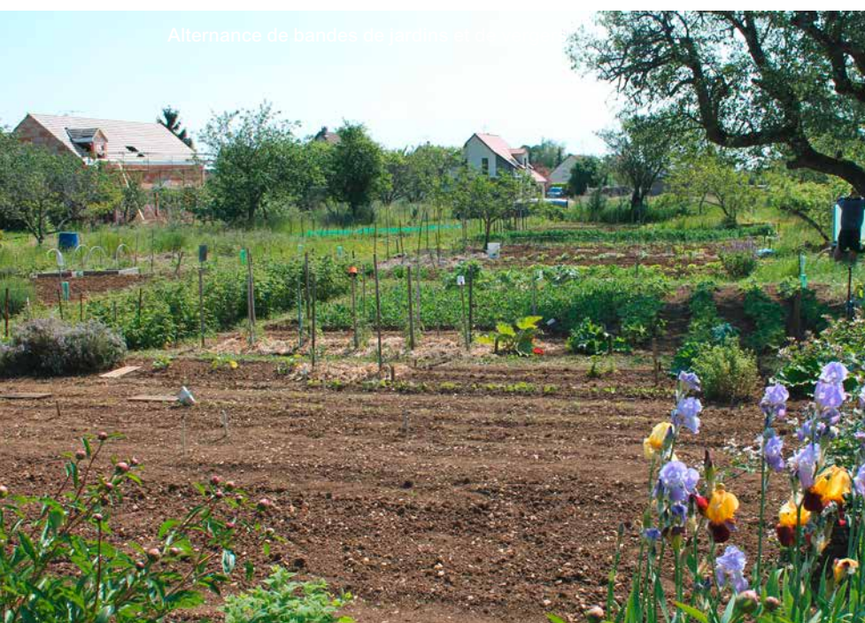
Alternance de bandes de jardins et de vergers