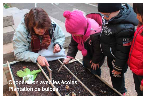
Coopération avec les écoles: Plantation de bulbes