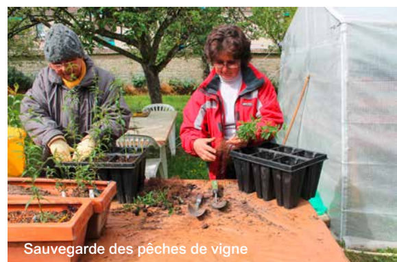
Sauvegarde des pêches de vigne