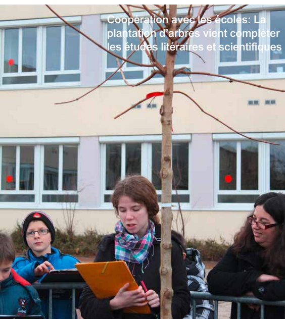
Coopération avec les écoles: La plantation d'arbres vient compléter les études littéraires et scientifiques