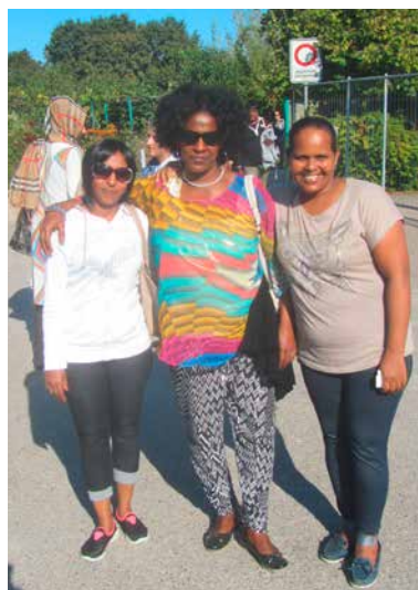
Trois jeunes femmes en forme