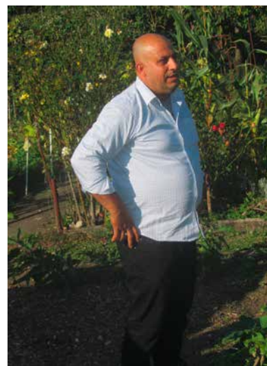
Mustafa Veli de Turquie