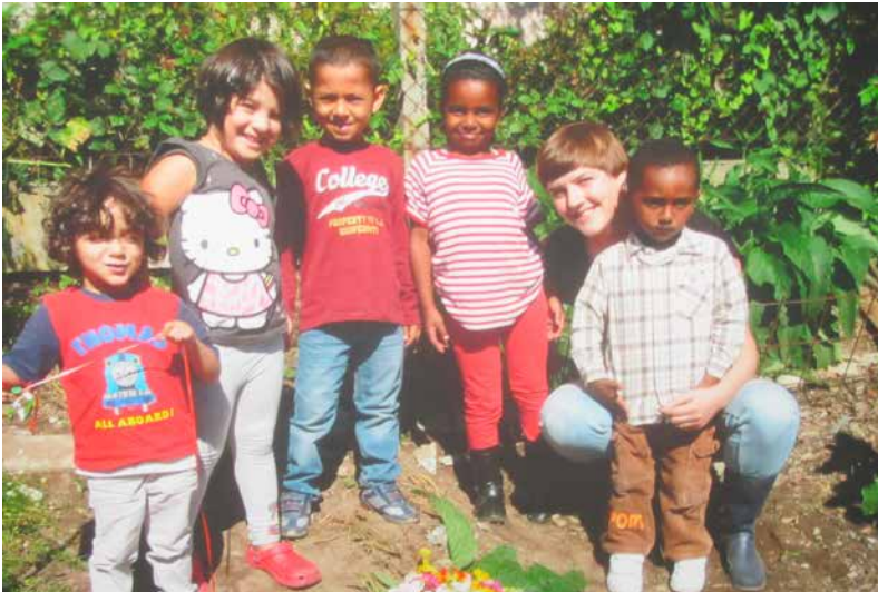
Une photo de l'exposition de photos