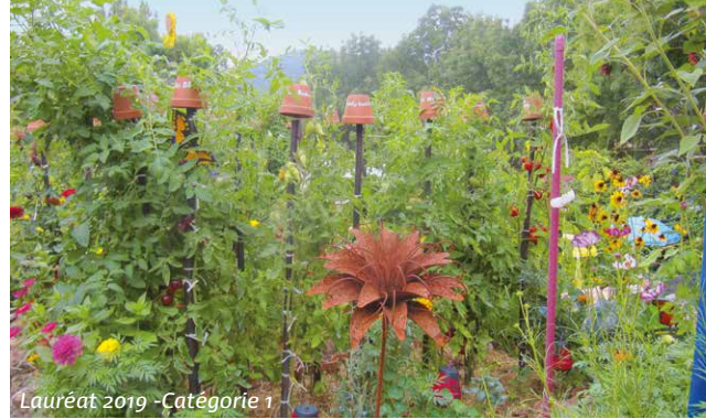
Lauréat 2019 - Catégorie 1

Association pour le Respect de l'Homme et de la Nature